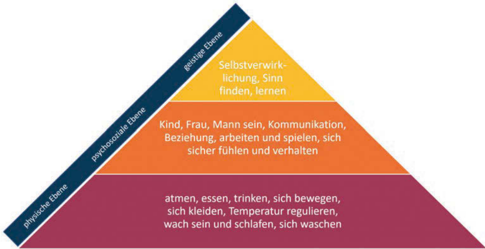
Aktivitäten des täglichen Lebens (nach Juchli in Anlehnung an Maslow)

Auf der physiologischen Ebene stehen Aktivitäten wie ‚Wachsein und Schlafen‘, ‚sich bewegen‘, ‚Waschen und Kleiden‘, ‚Essen und Trinken‘, ‚Ausscheiden‘, ‚Körpertemperatur regulieren‘ und ‚Atmen‘.