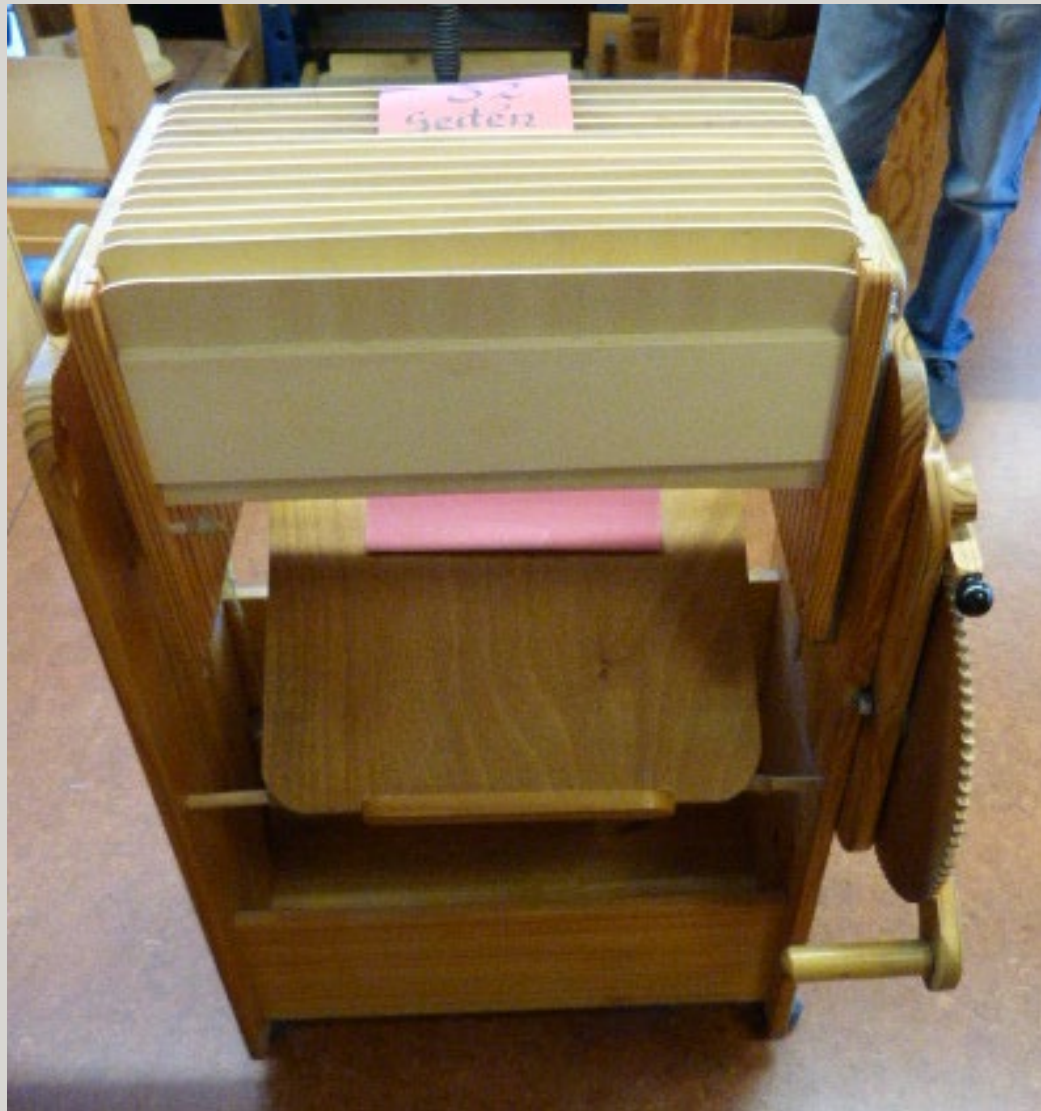
Blätter zählen, sortieren und aufeinanderlegen