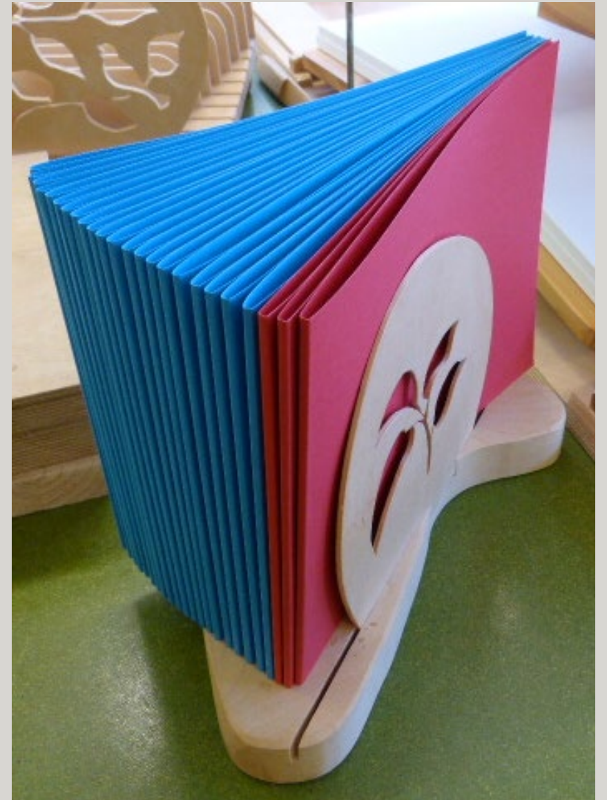
Vorrichtung zum Bereitstellen der Umschläge