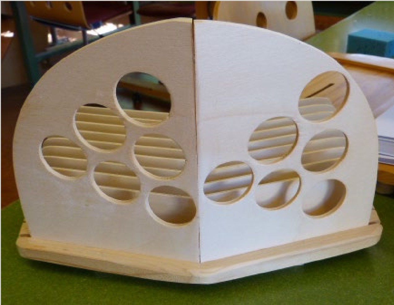
Ästhetische Gestaltung der Rückseite