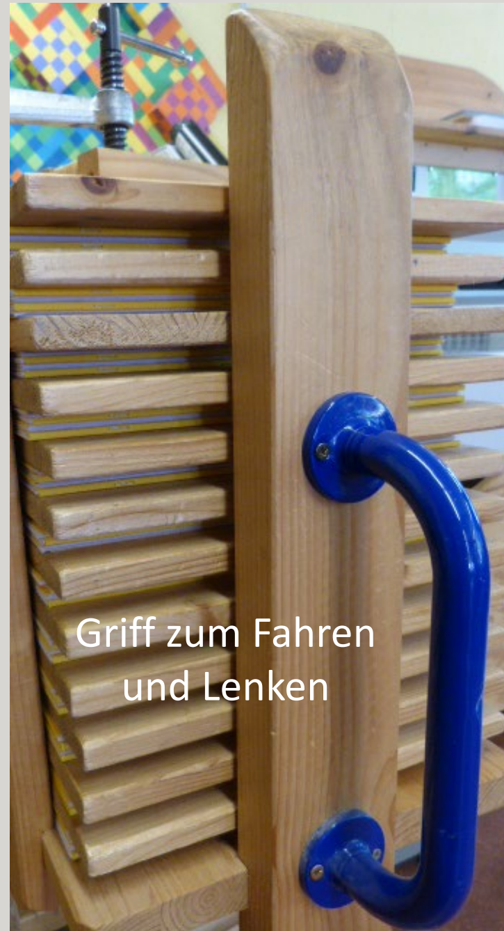
Griff zum Fahren und Lenken