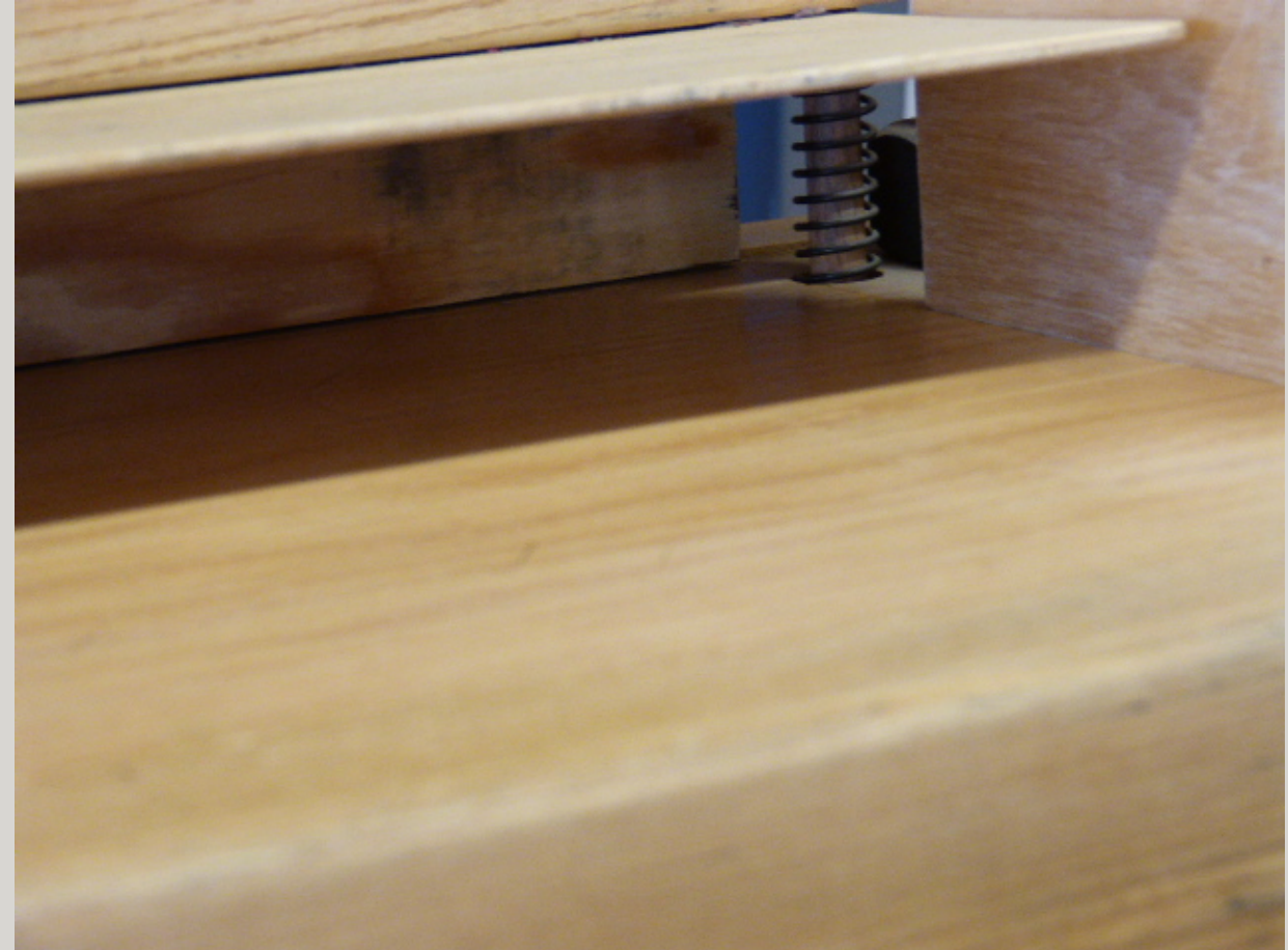
Einlagefach für zu pressende Hefe