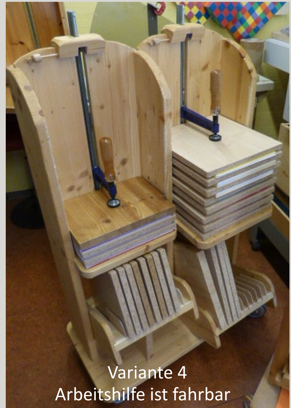
Variante 4 Arbeitshilfe ist fahrbar