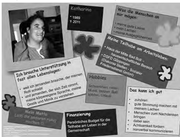
Abb. 3: Eine Seite über Katharina (Jerg & Sickinger 2014)

Im Rahmen des Projektes LebensTräume des Vereins Gemeinsam Leben – Gemeinsam Lernen für Inklusion im Landkreis Göppingen e. V. wurde beispielweise als Variation die folgende »Seite über mich« entwickelt (Jerg & Sickinger 2014).