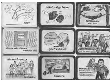
Abb. 2: Beispiel Kartensets

Bei den Hutkarten geht es darum, eigene Stärken und Fähigkeiten zu erkunden und zu überlegen, was man gerne erproben möchte (z. B. sortieren, malen, Gartenmensch, pünktliche Person).