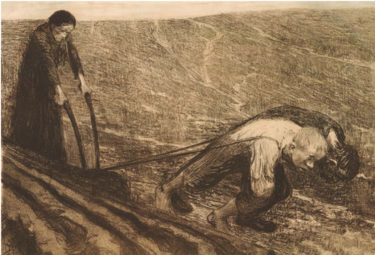
Käthe Kollwitz – Pflugzieher und Weib

In einem engeren Verständnis wird Arbeit als Erwerbsarbeit verstanden und meint dann Tätigkeiten, die der Herstellung von Gütern oder der Erbringung von Leistungen zum Zweck des Tausches auf Märkten dienen, d. h. Arbeit, von der man lebt oder durch die man verdient. In einem umfassenderen Sinne meint Arbeit körperliche und geistige Tätigkeiten des Menschen, die mit einem Ziel oder Zweck verbunden sind. Der Begriff „Arbeit“ meint auch das Ergebnis solcher Tätigkeiten (vgl. Kocka 2008, S. 445 f.). Allerdings müssen zielgerichtete körperliche und geistige Tätigkeiten nicht zwangsläufig als Arbeit verstanden werden. Für die meisten Menschen handelt es sich bei Tätigkeiten wie dem Lesen eines Romans oder dem Hören von Musik nicht um Arbeit.