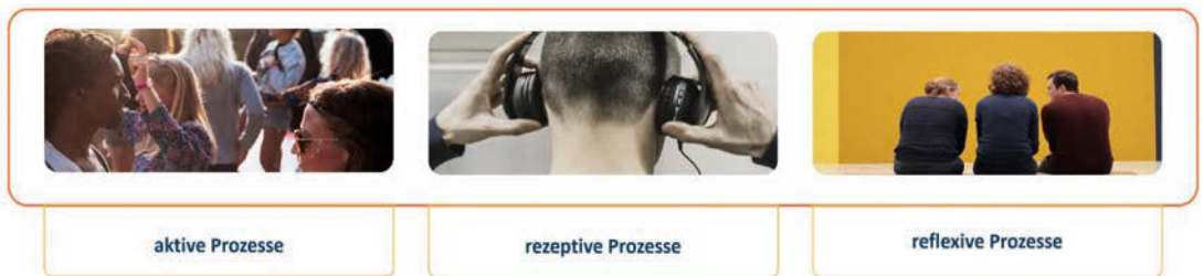
Prozesse der Teilhabe an Kultur

Hinsichtlich der Prozesse, die kulturelle Teilhabe ermöglichen, kann zwischen aktiven, rezeptiven und reflexiven Prozessen (vgl. Fuchs 2008) unterschieden werden: