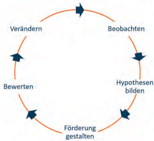
Kompetenzen erkennen und fördern als Prozess

„Kompetenzen erkennen und fördern“ ist kein einmaliger Vorgang, sondern ein wiederkehrender Prozess, in dem systematisch Informationen gesammelt werden. Die dadurch gewonnenen Erkenntnisse bilden die Grundlage für die Gestaltung einer Förderung. Um Kompetenzen erkennen und fördern zu können, genügen „nicht (nur) das Gefühl und eine Vermutung aus dem Bauch heraus“ (Schäfer 2019, S. 405). Vielmehr müssen aus den Beobachtungen Erkenntnisse abgeleitet und Hypothesen gebildet werden. Diese Annahmen werden dann in einem fortlaufenden Prozess bewertet und ggf. verändert (vgl. Bernasconi & Böing 2015, S. 185; vgl. Fröhlich 2015b, S. 433).