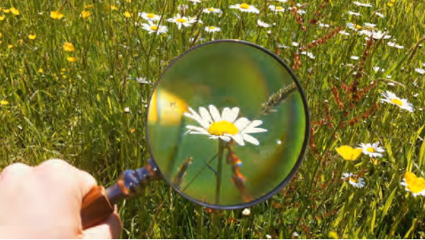
In den Blick nehmen